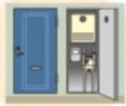
玄関脇のメーターボックス内に設置