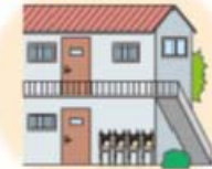
屋外に複数並べて設置