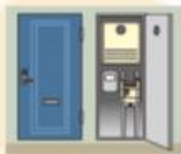
玄関脇のメーターボックス内に設置