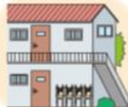
屋外に複数並べて設置